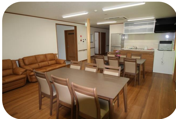
＜リビングダイニング＞