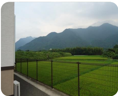
＜グループホームからの景色＞