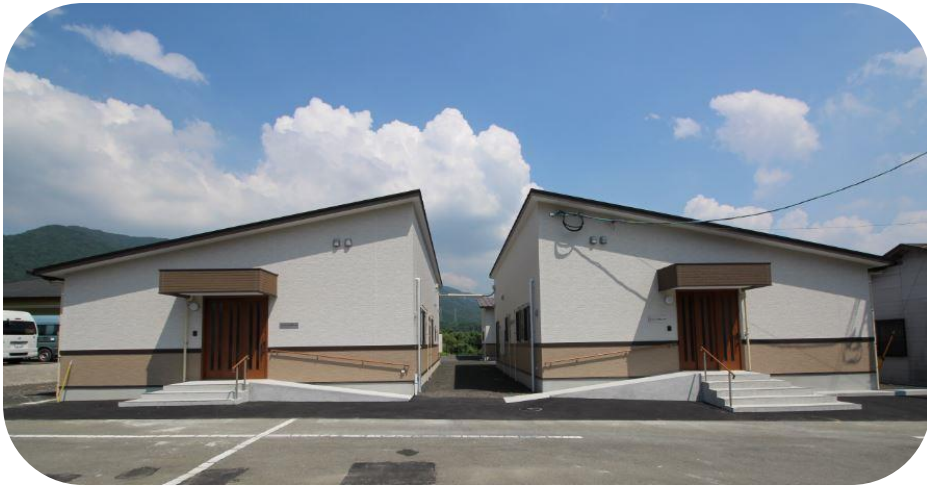
＜グループホームのぞみ外観＞